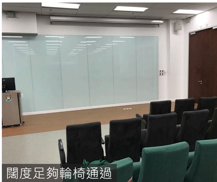
闊度足夠輪椅通過

課室門外的位置沒有無障礙入口指示，而且入口只設手動門，輪椅人士要拉門才能進入，不過闊度仍足夠輪椅通過。