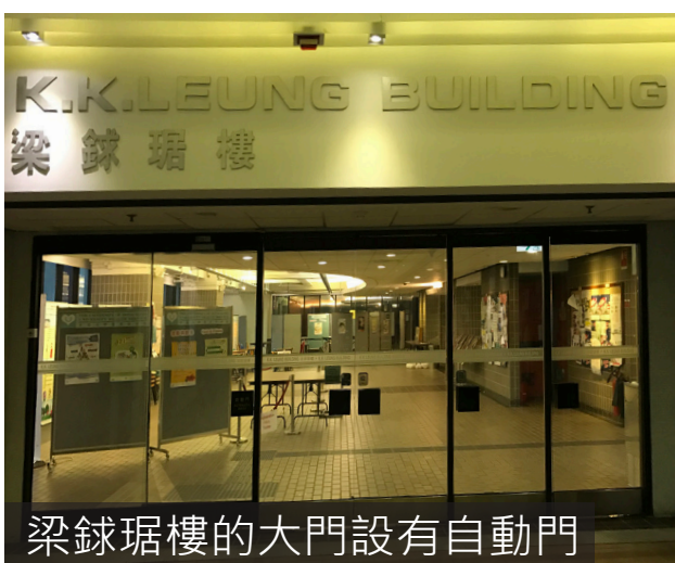
梁銑琚樓的大門設有自動門

其他教學樓不設自動門，但設有無障礙入口，地面平坦，旁邊設有標示，但門口頗為狹窄，而且重量對輪椅人士而言頗為吃力，因此進入時或需別人協助。