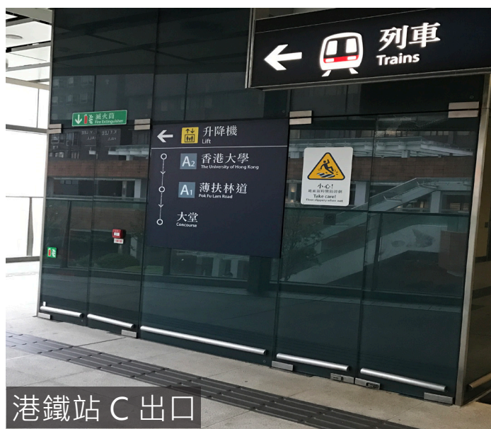
港鐵站 C 出口