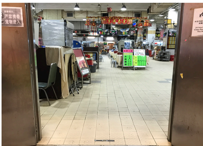
電梯大堂的門口保持開放或設有自動門，闊度足夠讓輪椅通過。