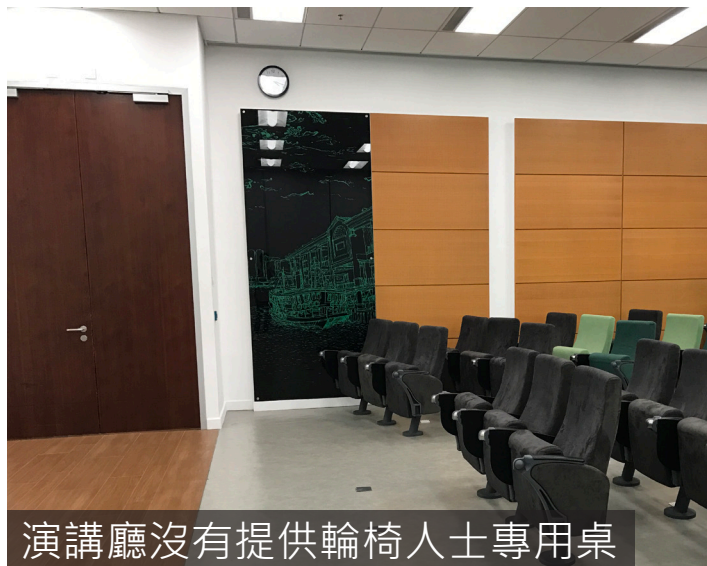
演講廳沒有提供輪椅人士專用桌

輪椅人士位置於課室最前方，較為安全，空間也足夠，但演講廳沒有提供輪椅人士專用桌。