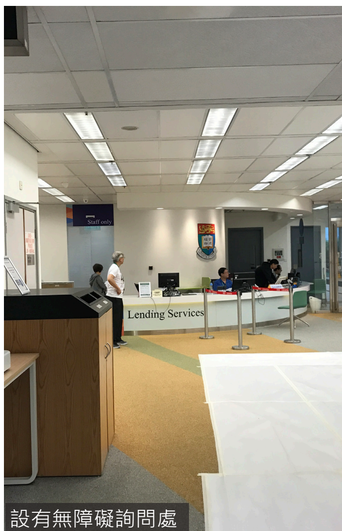
設有無障礙詢問處

入口旁設有適合輪椅高度的詢問處，管理員亦在門口旁當值，如有需要的話可以請求管理員協助。