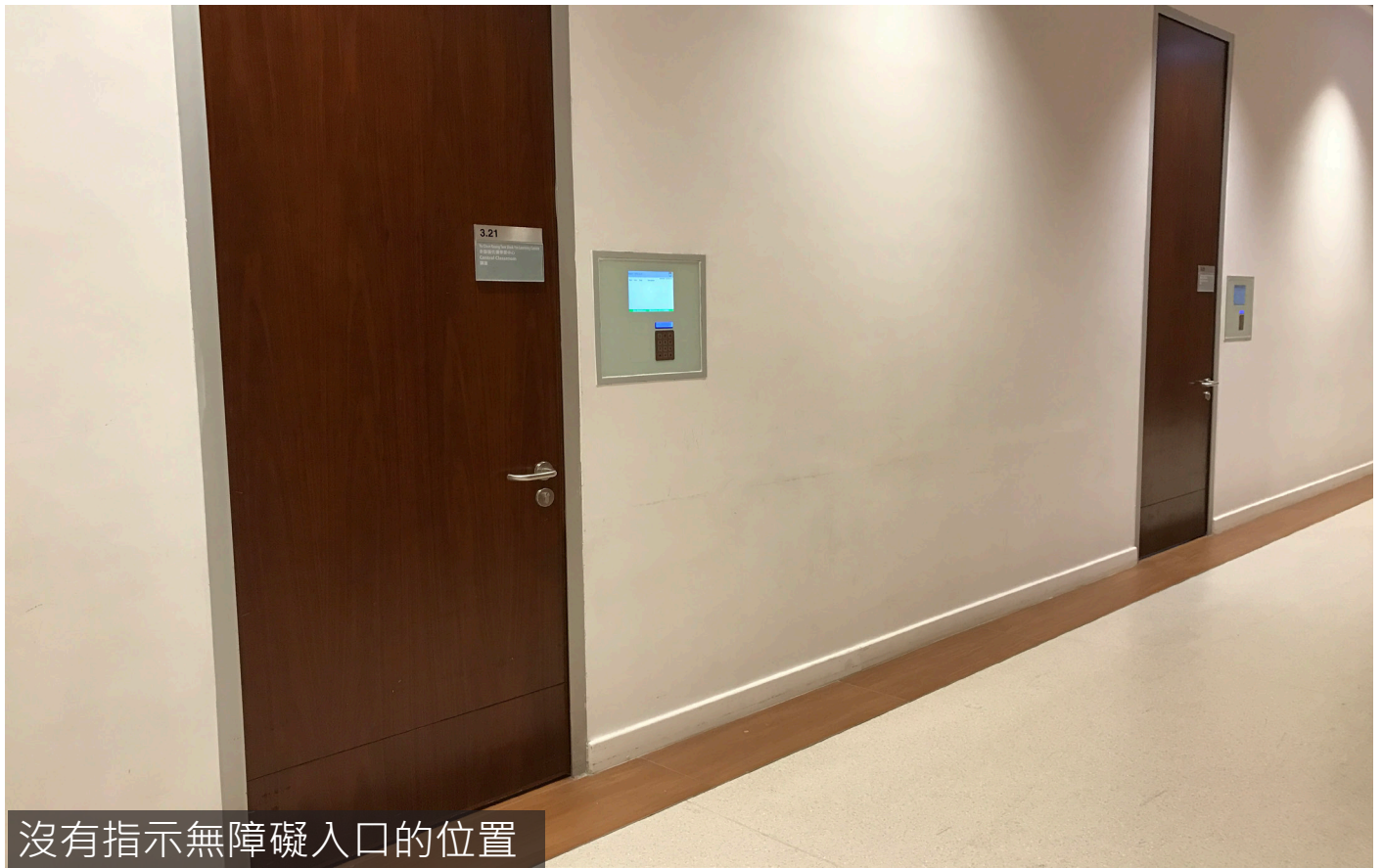
沒有指示無障礙入口的位置

課室門外的位置沒有無障礙入口指示，而且入口只設手動門，輪椅人士要拉門才能進入，不過闊度仍足夠輪椅通過。