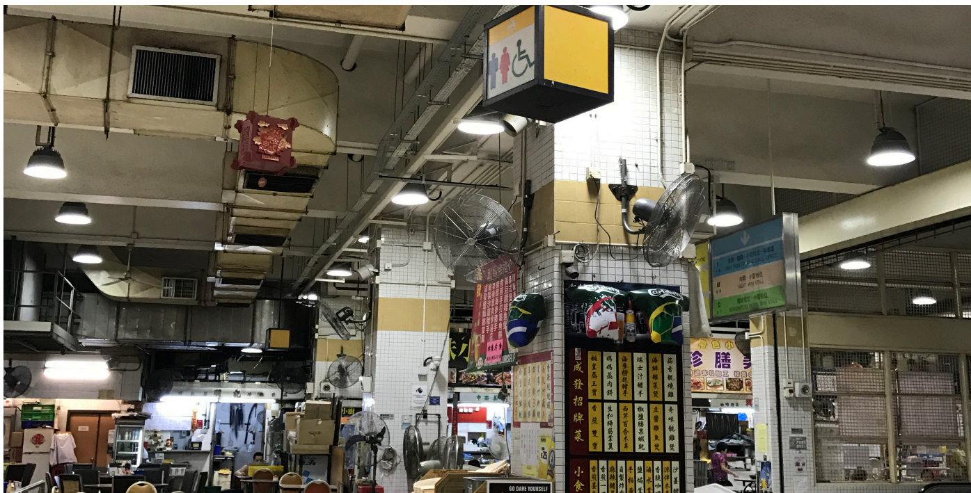
大廈部分樓層暢通易達洗手間的標示太高。