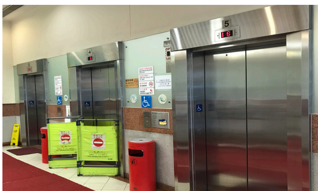
每層也配備了基本的無障礙設施，包括升降機和洗手間。