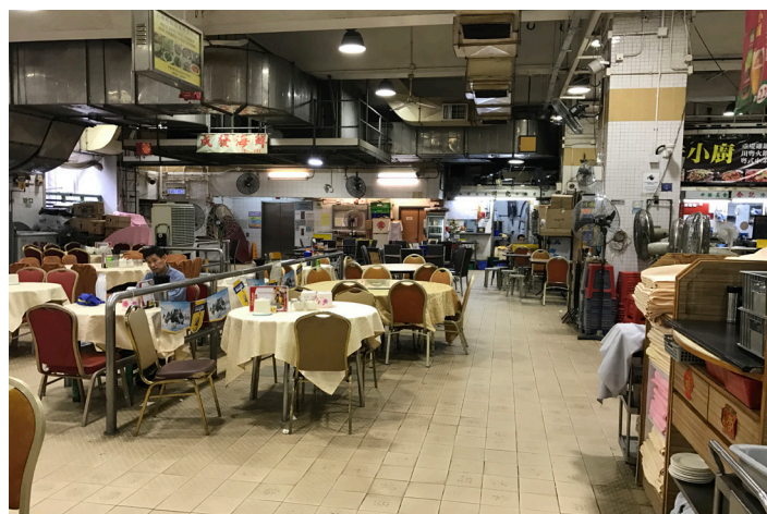
商場內通道非常寬闊，空間足夠輪椅移動，不設梯級，方便輪椅出入。