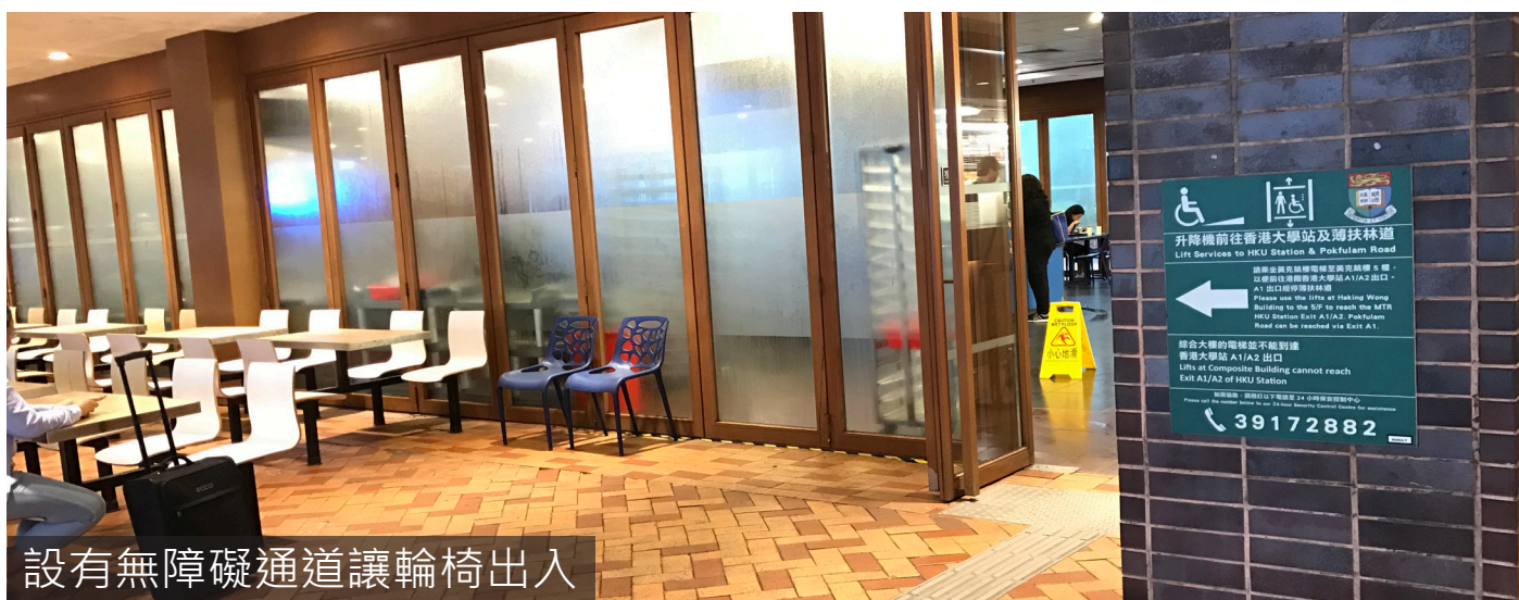
設有無障礙通道讓輪椅出入