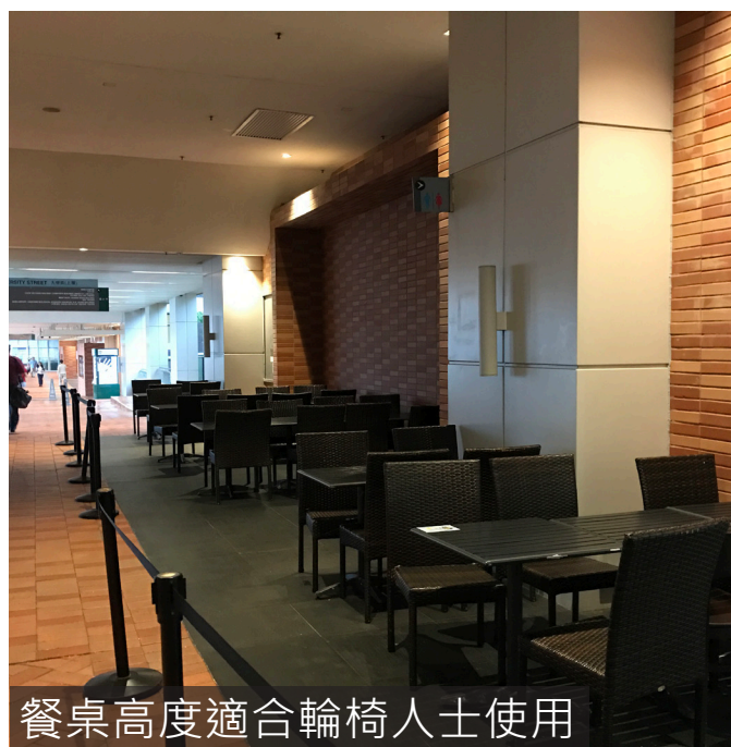
餐桌高度適合輪椅人士使用