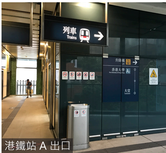
港鐵站 A 出口