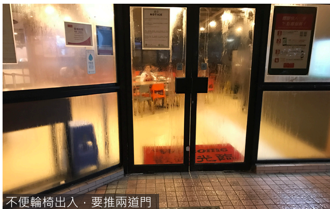
不便輪椅出入，要推兩道門