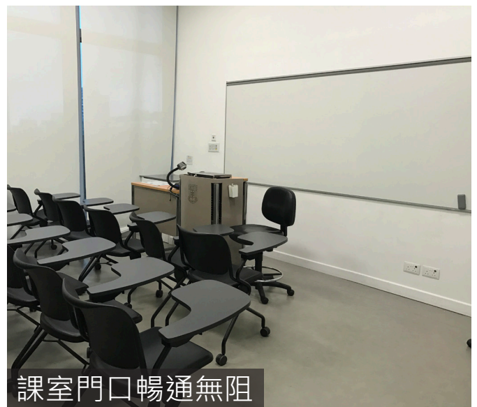
課室門口暢通無阻