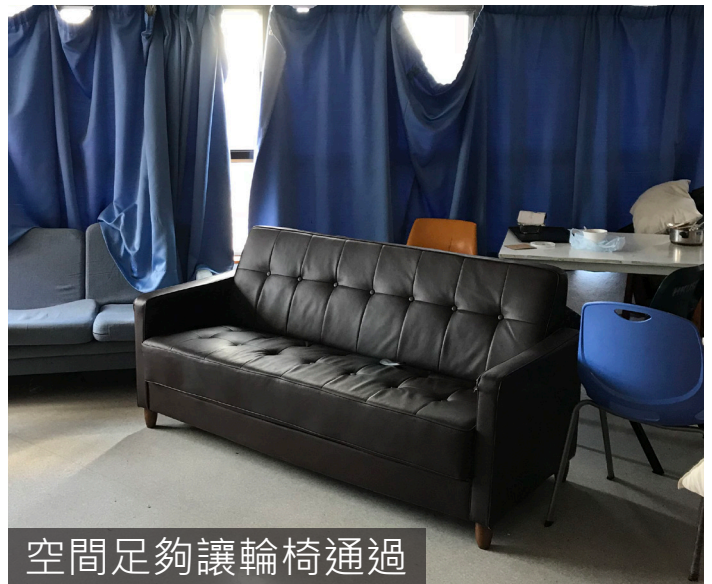
空間足夠讓輪椅通過