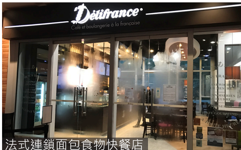
法式連鎖面包食物快餐店