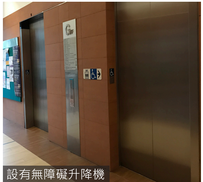
設有無障礙升降機